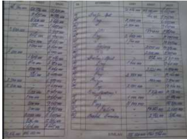
Gambar 1. Pencatatan laporan keuangan secara manual